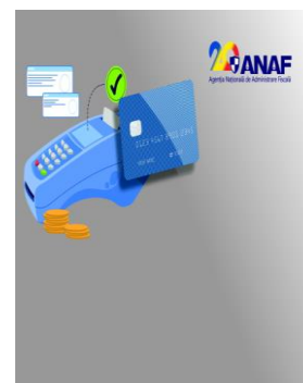
Broșura privind modalitățile de efectuare a plăților către Agenția Națională de Administrare Fiscală