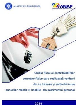
Ghid privind tratamentul fiscal aplicabil veniturilor obținute de persoanele fizice care realizează venituri din închirierea și subînchirierea bunurilor mobile și imobile din patrimoniul personal