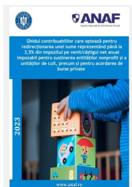
Ghidul contribuabililor care optează pentru redirecționarea unei sume reprezentând până la 3,5% din impozitul pe venit/câștigul net anual impozabil pentru susținerea entităților nonprofit și a unităților de cult, precum și pentru acordarea de burse private