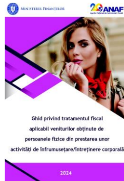
Ghidul privind tratamentul fiscal aplicabil veniturilor obținute de persoanele fizice din prestarea unor activități de înfrumusețare/întreținere corporală