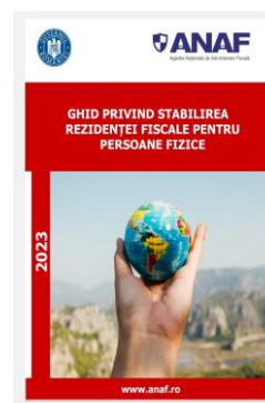
Ghidul privind stabilirea rezidenței fiscale pentru persoane fizice